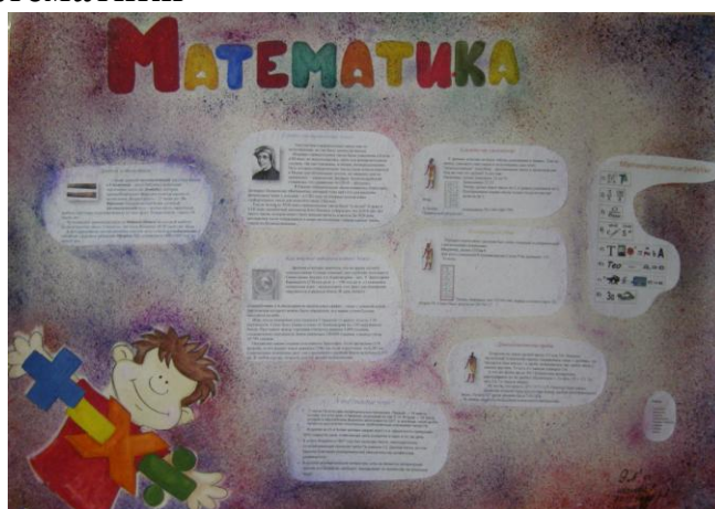
9 «А» класс