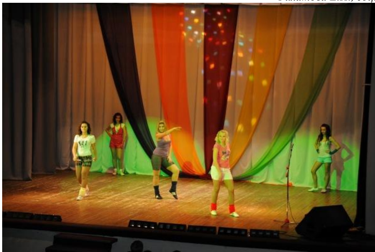
Победители конкурса 11 «Б» класс