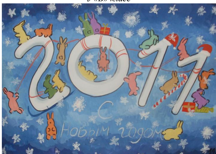
11 «Б» класс

Адрес: 141300, Московская область, г. Сергиев Посад, ул. Клубная, д.9 тел: 8(496)540-47-59, 549-17-02