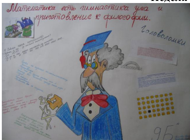
9 «Б» класс