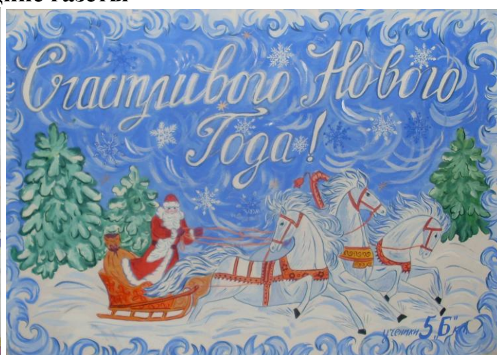
5 «Б» класс