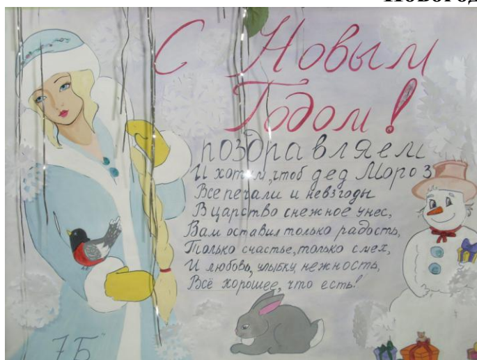
7 «Б» класс