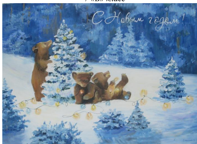
9 «Б» класс