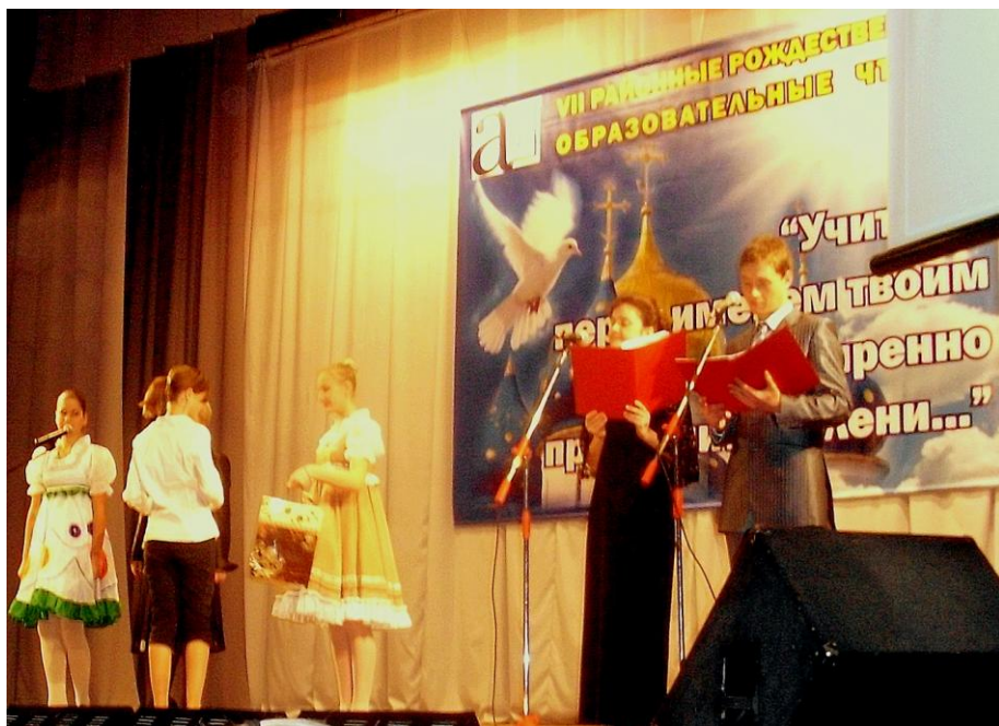
Получение награды в ОДЦ «Октябрь»

21 декабря в ДК «Октябрь» состоялось закрытие рождественских чтений, где нам вручили грамоту победителя и приз.