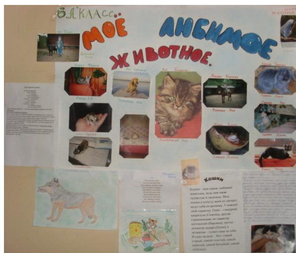
Фотовыставка «Наши любимые животные» - 26-28 января 2011 год

Адрес: 141300, Московская область, г. Сергиев Посад, ул. Клубная, д.9 тел: 8(496)540-47-59, 549-17-02