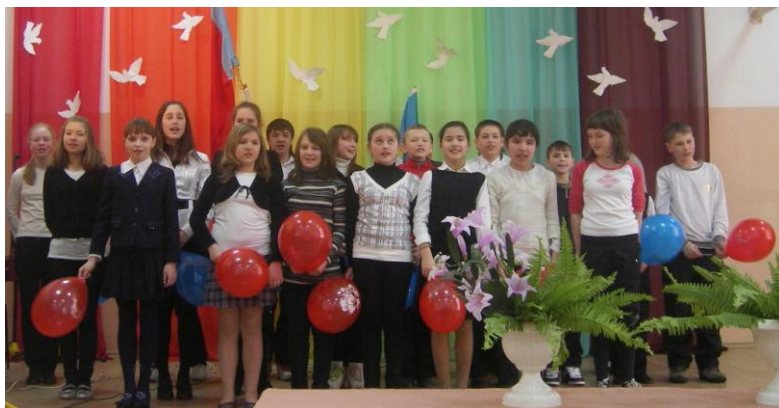
6 «А» класс

Выступления учащихся были очень трогательными. Прозвучали песни военных и послевоенных лет, а также современные композиции. Синий платочек, Идёт солдат по городу, На безымянной высоте, Песня фронтового шофёра, Варяг, Мы армия – народ, С чего начинается Родина, Тучи в голубом, Экипаж – одна семья, Едут по Берлину казаки, Москва – звонят колокола, Граница, Служить России, Адмирал. По окончании конкурса классы были награждены школьными грамотами.