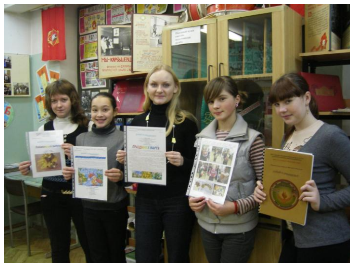
В школьном музее

Наша школьная газета «Юный карбышевец» впервые появилась на свет в декабре 2009 года. Поэтому мы находимся ещё на начальном пути своего развития. И надеемся, что эта традиция сохранится на долгие годы, будет беречь память жизни и существования всех школьных дней, отражая интересные события и мероприятия, рассказывая о людях, работающих и учащихся, затрагивая важные и актуальные темы для школы.