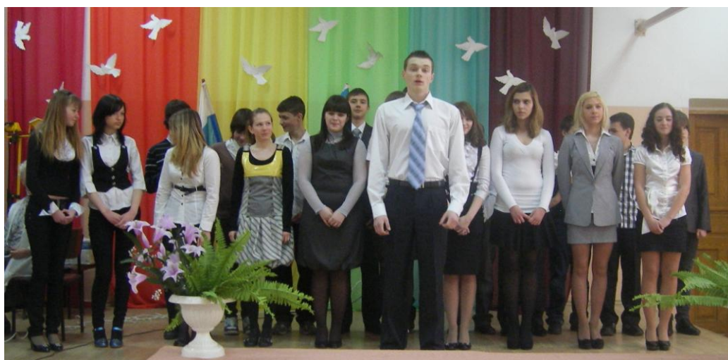
8 «Б» класс

Выступления учащихся были очень трогательными. Прозвучали песни военных и послевоенных лет, а также современные композиции. Синий платочек, Идёт солдат по городу, На безымянной высоте, Песня фронтового шофёра, Варяг, Мы армия – народ, С чего начинается Родина, Тучи в голубом, Экипаж – одна семья, Едут по Берлину казаки, Москва – звонят колокола, Граница, Служить России, Адмирал. По окончании конкурса классы были награждены школьными грамотами.