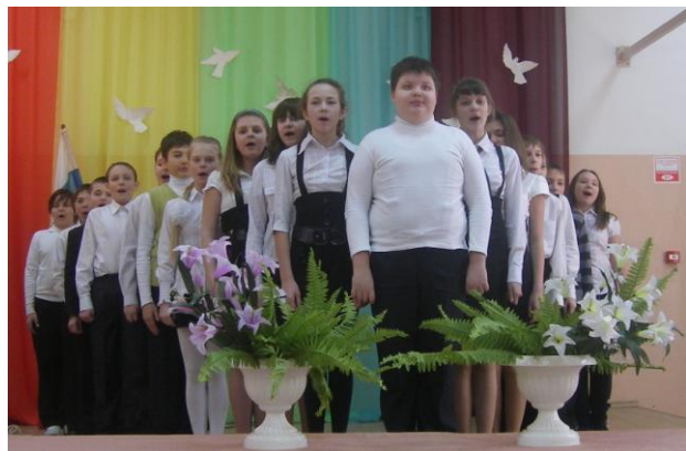
6 «В» класс

25 февраля в школе состоялся масштабный конкурс песен, посвящённый Дню Защитника Отечества, где приняли участие практически все учащиеся 5-11 классов. В связи с тем, что актовый зал не смог вместить всю школу полностью, решено было проводить конкурс частично для параллелей.