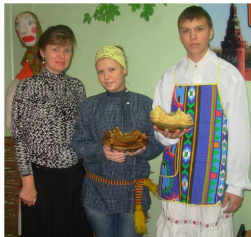
Широкая масленица – 2 марта 2011 год