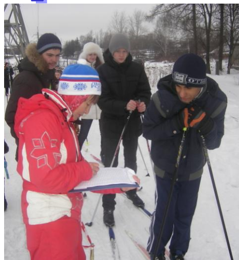
Соревнования по лыжам, посвящённые памяти Д.М. Карбышева – 3 марта 2011 год