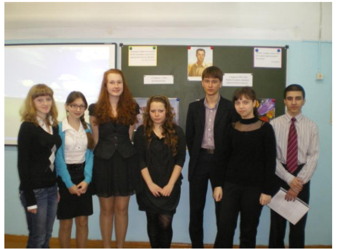
Участники секции История и английский язык