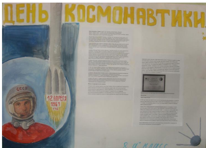
8 «А» класс