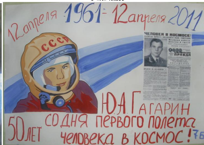
7 «Б» класс