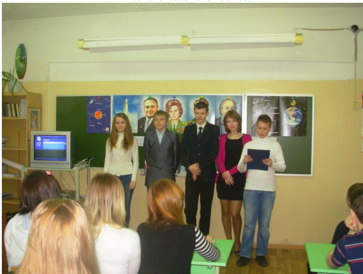
Классный час в 8-ых классах «Прабабушка – наша Вселенная»

11 апреля 2011 года в районе проходил единый классный час, посвящённый 50-летию полёта в космос.