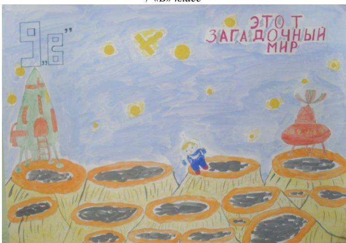
9 «Б» класс

Адрес: 141300, Московская область, г. Сергиев Посад, ул. Клубная, д.9 тел: 8(496)540-47-59, 549-17-02, факс: 8(496)540-47-59,549-17-02