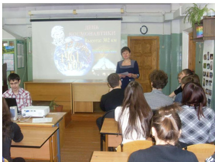
9-ые классы «Через тернии к звёздам»