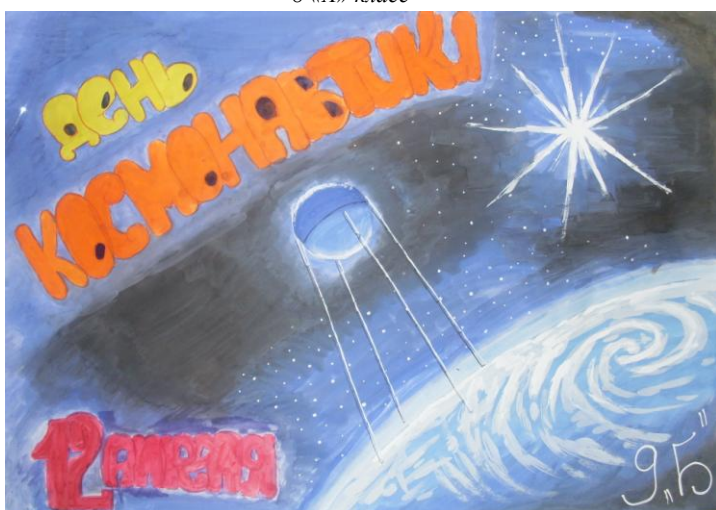
9 «Б» класс