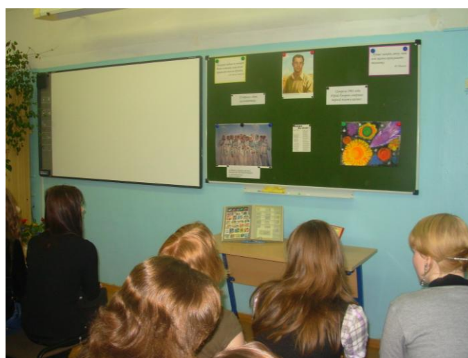
Классный час в 11 классах

1-ые классы встречались с библиотекой Горловского на мероприятии «Ко дню космонавтики» 3-ьи классы с библиотекой п. Скобянка на мероприятии «Первый космонавт Земли».