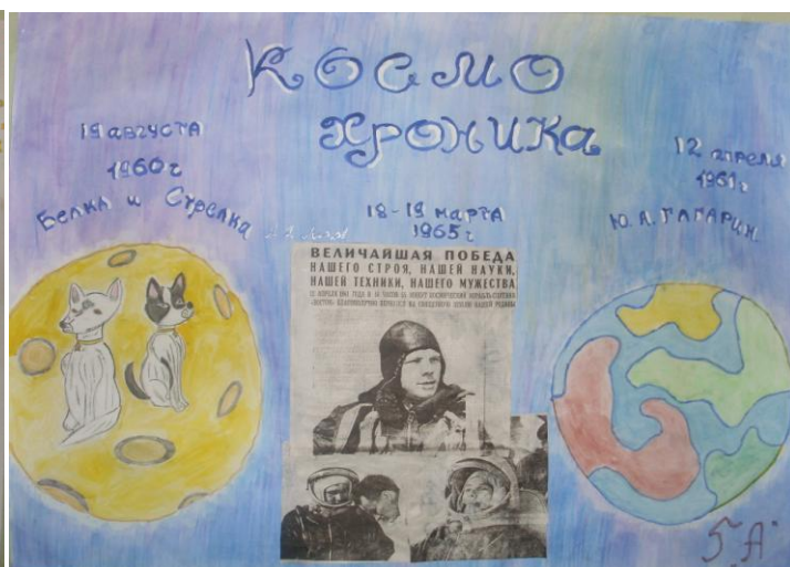
5 «А» класс