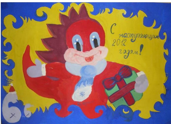
6 «Б» класс