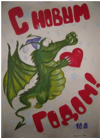
10 «А» класс