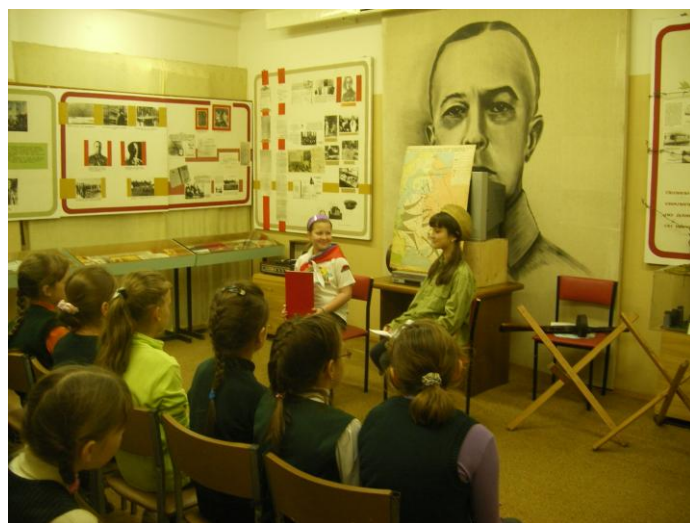
4 «А» на экскурсии в музее Д.М. Карбышева