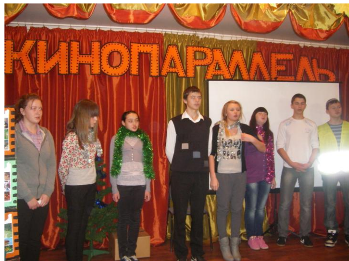
8 «А» на районном конкурсе Кинопараллель