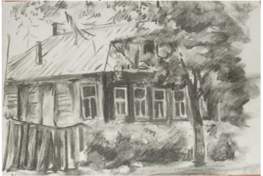
Графика «Старый город»