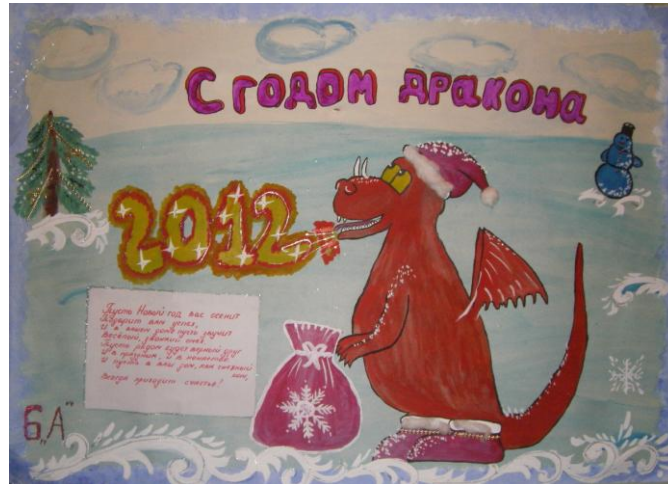
6 «А» класс