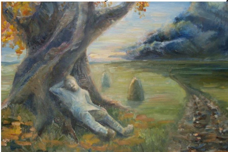
Масло «Крестьянская жизнь» 2010 г.

Благодарим тебя за твою выставку и желаем дальнейших творческих успехов!