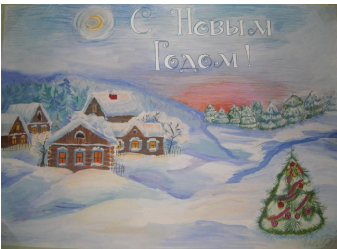
10 «Б» класс