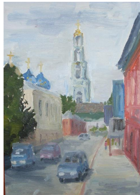
Масло «Вид на Колокольню» 2010 г.

Катя, как давно ты занимаешься живописью? И в какой художественной школе, Ф.И.О. твоего учителя?