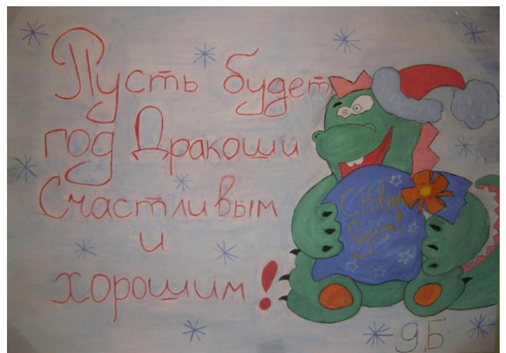
9 «Б» класс