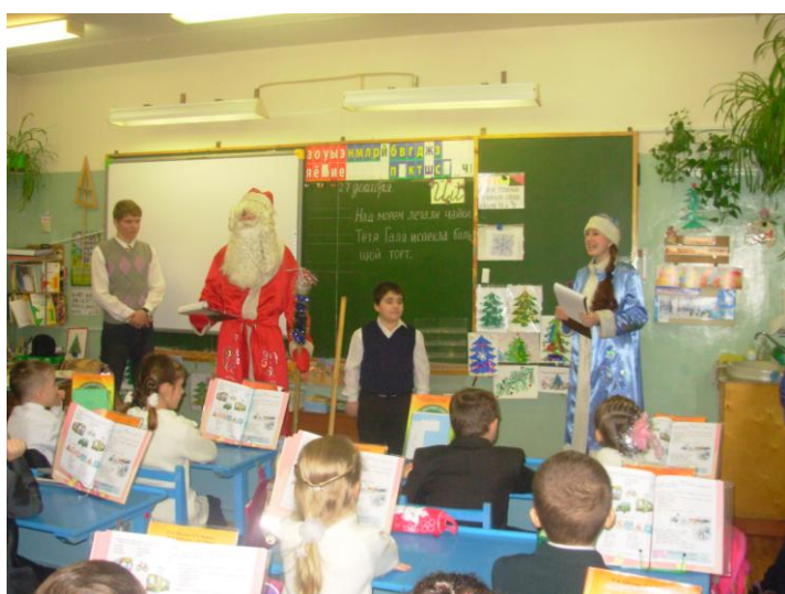
Поздравление от Деда Мороза и Снегурочки