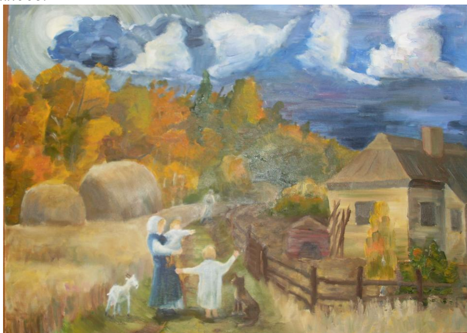
К 70-летию Московской битвы «Прощание» (отец уходит на войну)

В детстве очень любила рисовать и рисовала много; мама решила отдать меня в изостудию в ДТДМ, потом поступила в художественную школу. Так что я не выбирала, так само получилось.