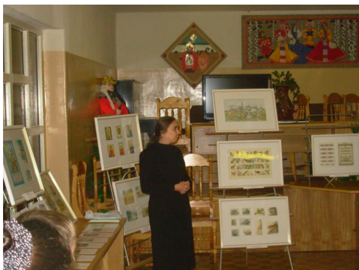
Выездная художественная выставка в школе