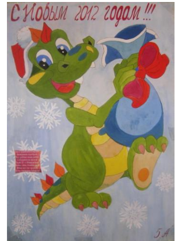
5 «А» класс