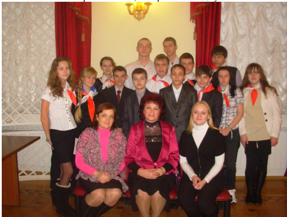
Делегация от школы на закрытии VIII районных Рождественских образовательных чтений