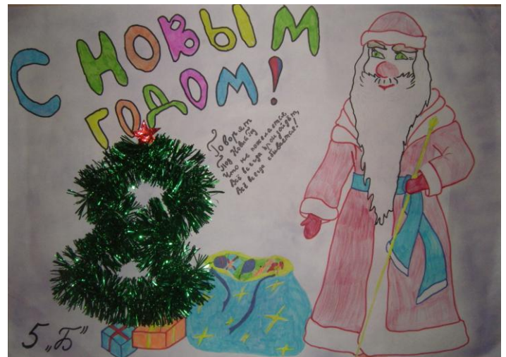
5 «Б» класс

141300, Московская область, г. Сергиев Посад, ул. Клубная, д.9 тел: 8(496)540-47-59, 549-17-02, факс: 8(496)540-47-59, 549-17-02