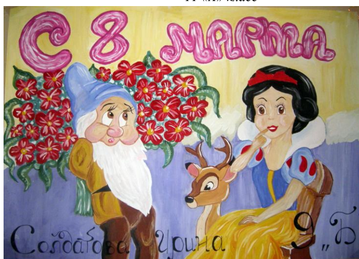
9 «Б» класс