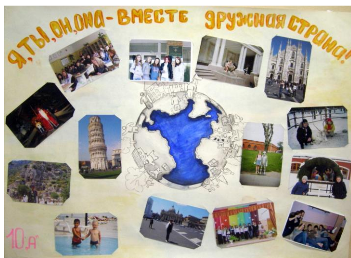
10 «А» класс