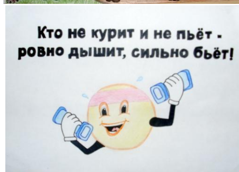
Конкурс рисунков «Если хочешь быть здоров!», 21 марта 2012 г.