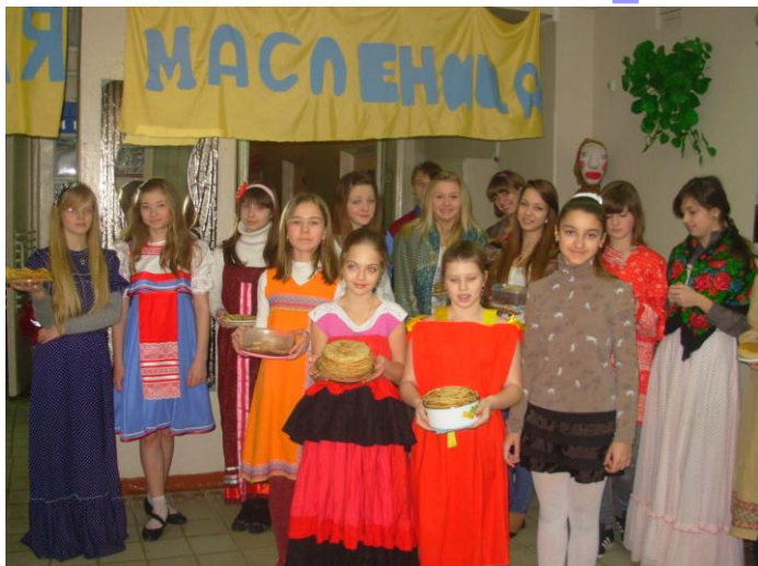
Масленица. 20 февраля 2012 г.