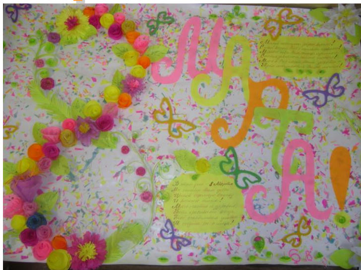
6 «В» класс