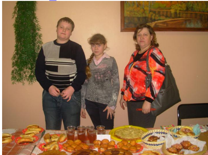
Сладкая Ярмарка, 5 «В». 24 февраля 2012 г.