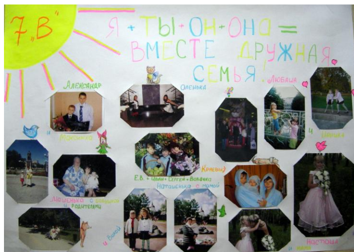
7 «В» класс Фотовыставка «Я, ты, он, она – вместе дружная страна!», 1 февраля 2012 г.