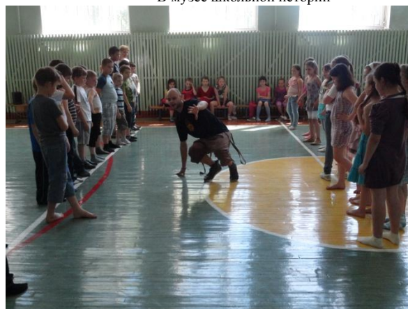
В гостях танцевальная студия «Триш»

Адрес: 141300, Московская область, г. Сергиев Посад, ул. Клубная, д.9 тел: 8(496)540-47-59, 549-17-02