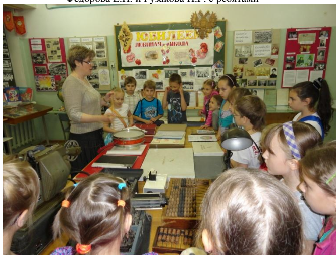
В музее школьной истории