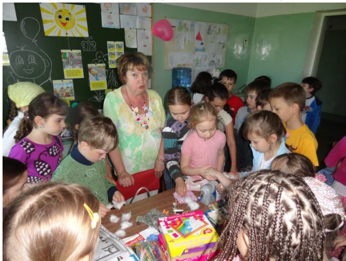
В гостях музеев. Делаем тряпичные куклы