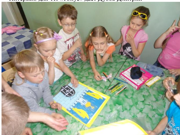
В гостях краеведческий музей