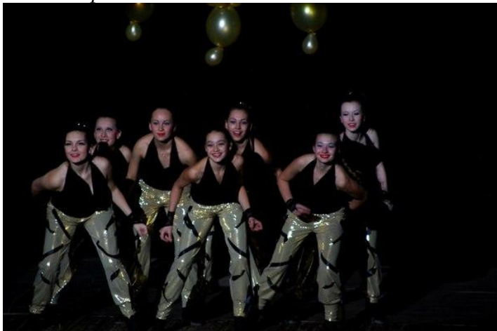
Танец «Коффе-тайм» в исполнении учениц школы