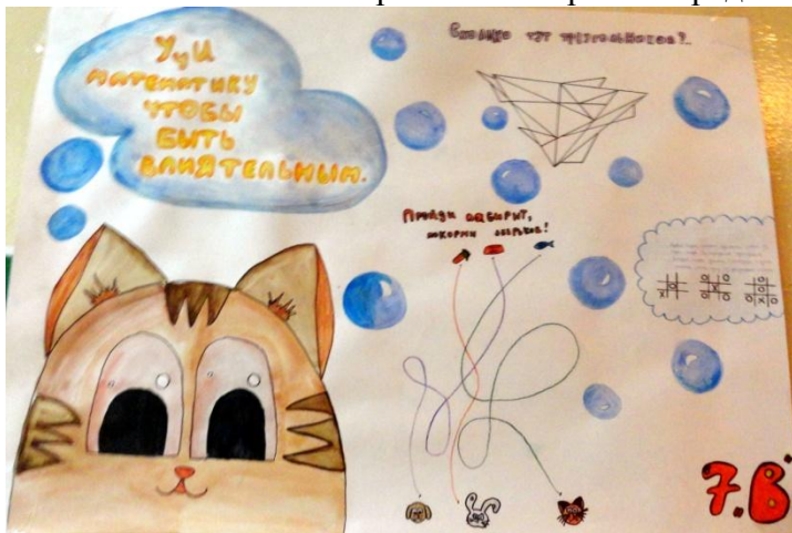
7 «В» класс

С 19 по 26 ноября в школе прошла предметная неделя по математике и информатике.