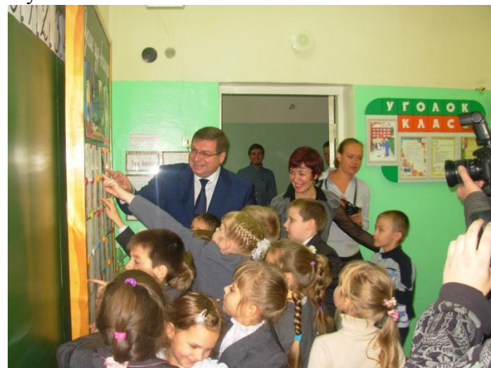
В 1 «А» классе

После классного часа гостям школы провели небольшую экскурсию. Они побывали в начальной школе. Заглянули к ребятам в классы и пообщались с ними. Побывали в медицинском кабинете, который прошёл лицензирование в этом учебном году, что есть не в каждой школе. Посетили спортзал. Не прошли мимо и школьной столовой.