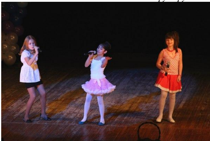
Ученицы 5 «А», песня Буги-Вуги»

Я бы хотела пожелать всем родителям, чтобы они растили добрых, неравнодушных и ответственных детишек. А ребятам хотелось бы сказать, что в нашей жизни все зависит от них самих. Надо быть самостоятельными и трудолюбивыми, целенаправленно добиваться своих целей. И, конечно же, невозможно жить без любви. Любите друг друга и не забывайте о своих близких.