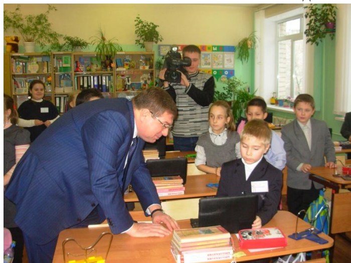
Во 2 «А» классе