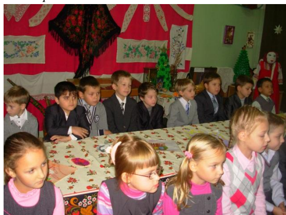
1 «Б» класс